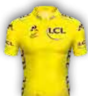
CLASSEMENT GÉNÉRAL AU TEMPS LCL