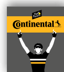
VICTOIRE D'ÉTAPE CONTINENTAL