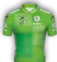
CLASSEMENT PAR POINTS ŠKODA