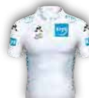
CLASSEMENT DU MEILLEUR JEUNE KRYS