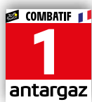
PRIX DE LA COMBATIVITÉ ANTARGAZ