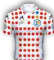
CLASSEMENT DU MEILLEUR GRIMPEUR E.LECLERC